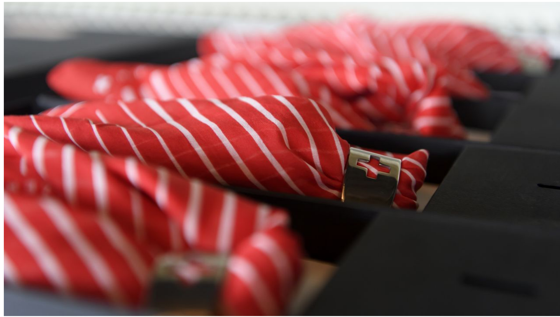
Le Mérite suisse est décerné par la Fondation pour la promotion du goût.