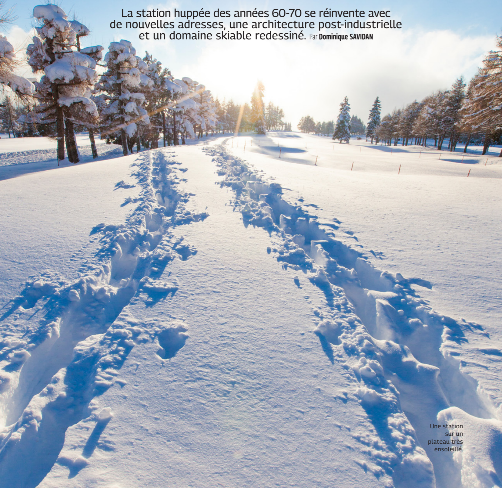
Une station sur un plateau très ensoleillé.

La station huppée des années 60-70 se réinvente avec de nouvelles adresses, une architecture post-industrielle et un domaine skiable redessiné. Par Dominique SAVIDAN